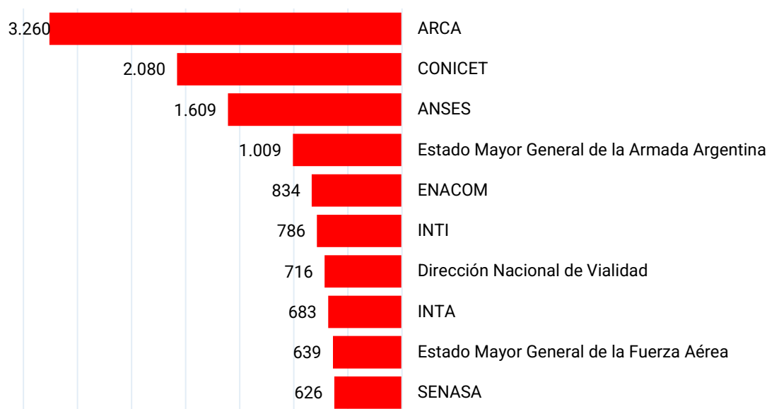
Gráfico 4. Variación de la dotación de personal de la Administración Pública Nacional desconcentrada y descentralizada con mayor ajuste en cantidades. Noviembre 2023 a noviembre 2025

En conjunto, estos recortes reflejan una política de ajuste que no distingue entre áreas técnicas, científicas, sociales o administrativas. El enfoque parece ser cuantitativo más que estratégico: se reduce personal sin un análisis del impacto institucional ni de las capacidades públicas que se están desarticulando. Lejos de modernizar o eficientizar al Estado, estas medidas tienden a vaciarlo de contenido, conocimiento y herramientas para intervenir en el desarrollo nacional.