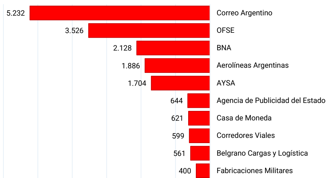
Gráfico 2. Variación de la dotación de personal de las diez empresas o sociedades del Estado con mayor ajuste en cantidades. Noviembre 2023 a noviembre 2025

Estos datos no solo reflejan una política de ajuste, sino también un profundo cambio en la concepción del rol del Estado, con consecuencias directas sobre miles de trabajadores y sobre áreas clave para la infraestructura, la soberanía y el desarrollo nacional.