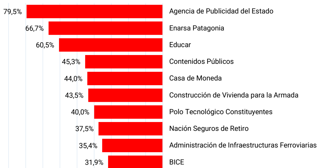
Gráfico 3. Variación de la dotación de personal de las diez empresas o sociedades del Estado con mayor ajuste en porcentaje. Noviembre 2023 a noviembre 2025